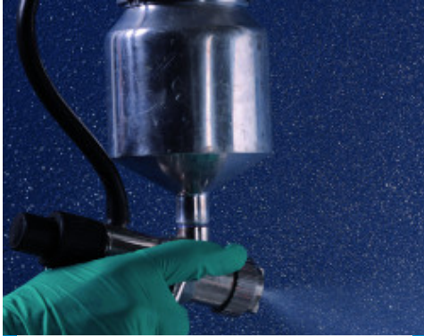
Mapelux Lucida és Mapeglitter Ezüst keverékének a felvitele Silancolor Tonachino vakolatra

A MapeGlitter a készítmények jelenlegi szabályozása és besorolása alapján nem minősül veszélyes anyagnak. Javasoljuk, hogy használjon védőkesztyűt és védőszemüveget, valamint tartsa be a vegyi anyagok kezelésére vonatkozó előírásokat! További és teljeskörű információt a termék biztonságos használatáról az érvényes Biztonsági Adatlap tartalmaz. SZAKEMBEREK SZÁMÁRA KÉSZÜLT TERMÉK.