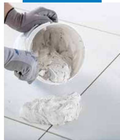
Krémes, homogén keveréket kapunk

A két komponens fent leírt bekeverése után megfelelő fogazatú simítóval terítse el a ragasztót az aljazaton. Erősen nyomja bele a