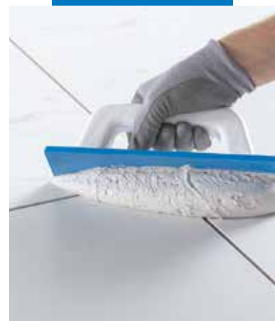
A Kerapoxy Easy Design-t Mapei simítóval terítse el