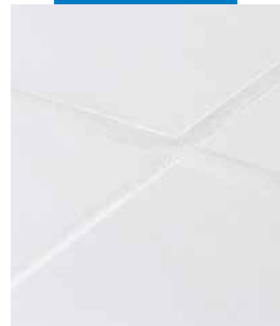
Kerapoxy Easy Design-nal fugázott padló

A Kerapoxy Easy Design -t a keverési arányokat gondosan mérve, az A és B kompo-