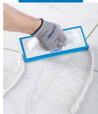
Könnyen felhordható epoxi fugázó