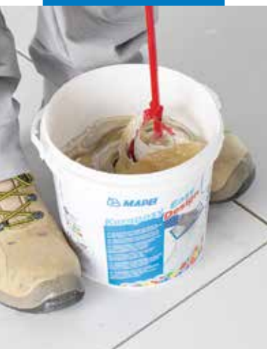
Keverje össze a komponenseket (A+B)

eredmény a használt színek és mennyiségek függvényében változhat, azonban a maximális 3 tömeg%-os adagoláson belül, hogy ne befolyásolja a fugázó/habarcs bedolgozhatóságát. Helyesen alkalmazva a Kerapoxy Easy Design a következő tulajdonságokkal rendelkező fugahézagokat biztosít: