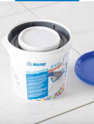
Kétkomponensű fugázó vödörös kiszerelésben, mely tartalmazza az A és B komponens is