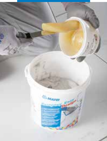
Öntse az edzőt (B komponens) az A komponens edényébe