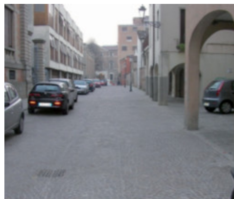
Járműforgalomnak kitett utcára