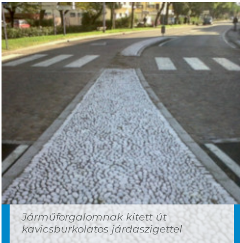
Járműforgalomnak kitett út kavicsburkolatos járdaszigettel