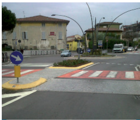
Sebességkorlátozó küszöbre gyalogátkelőnél