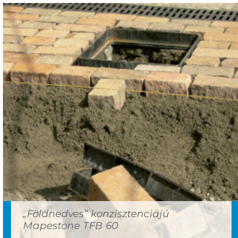
„Földnedves” konzisztenciájú Mapestone TFB 60